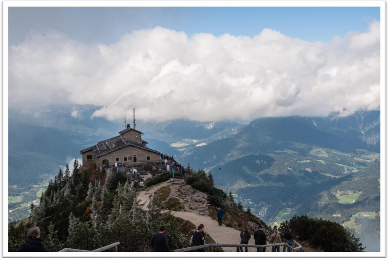
Pohled na Orlí hnízdo chata Kehlsteinhaus