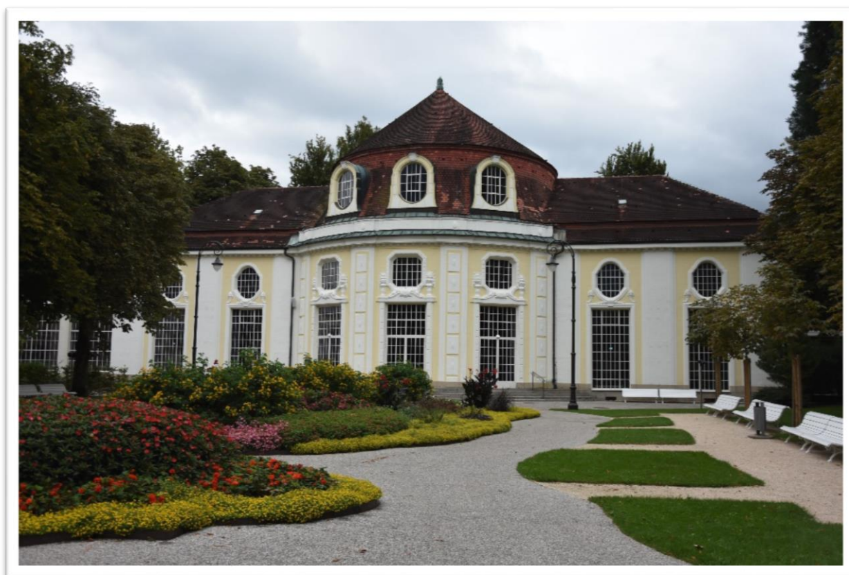
Brzké ráno v lázních Bad Reichenhallu

25. září 2018 jsme se vydali na cestu do oblasti solné komory Berchtesgaden v bavorském Německu.