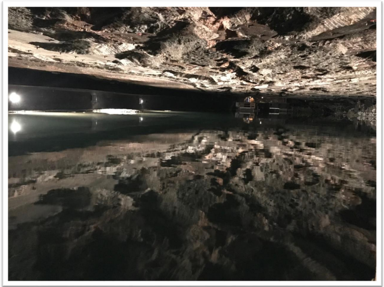
Podzemní jezero v solném dole