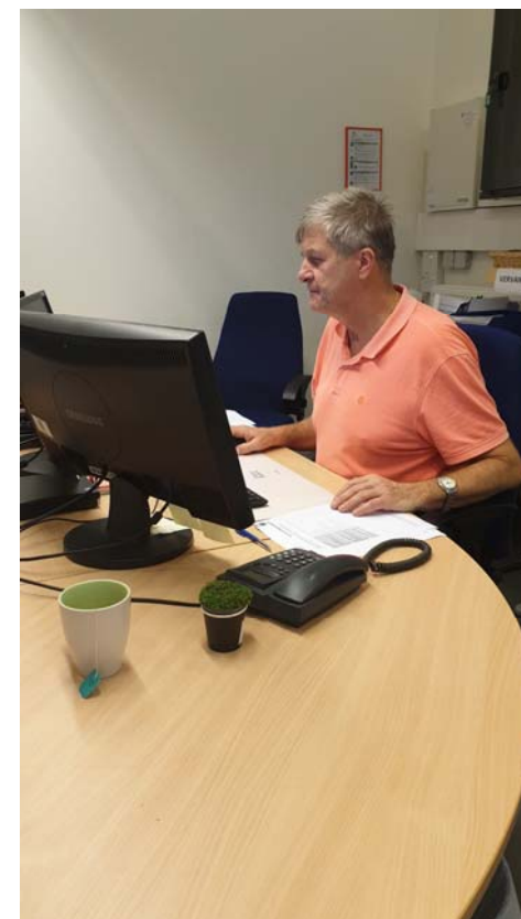
AR při práci na administrativním zajištění stáže