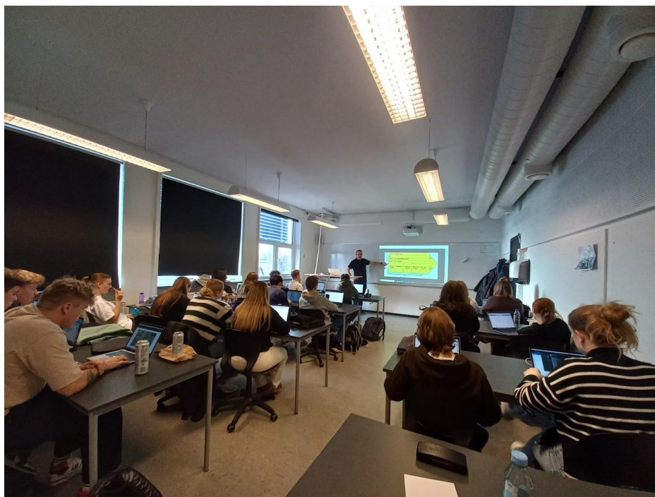
Hodina podnikové ekonomiky

Výzva 54 SPŠST Panská CZ.07.4.68/0.0/0.0/19_071/0001903 Tradium College, Dánsko