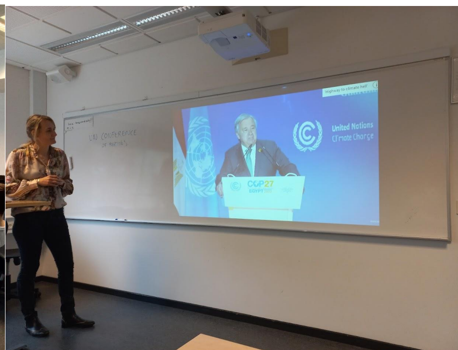
Hodina mezinárodní ekonomiky